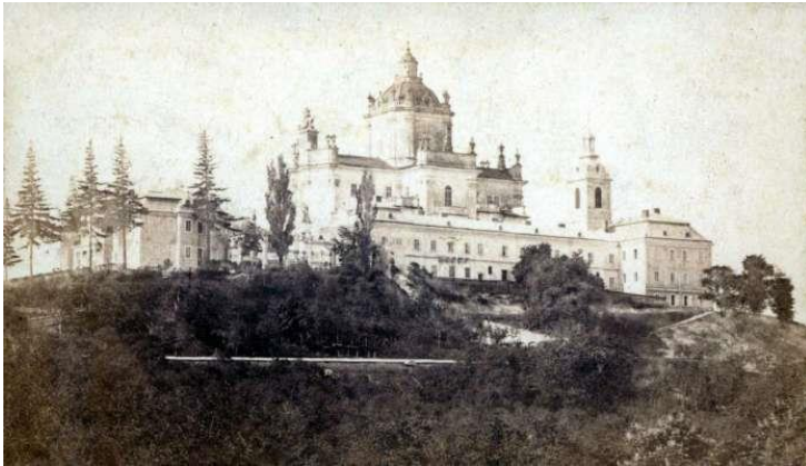
Собор Юра, ймовірно авторства Кароля Фердинанда Лянга, 1865 рік

Проте несподівано для себе у 1901 році в Римі він стає митрополитом по благословенню Папи Римського. Тоді його життя починає змінюватися.