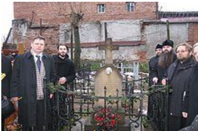
Символічна могила (кенотаф) Климента Шептицького на Князь-Владимирському цвинтарі у Володимирі