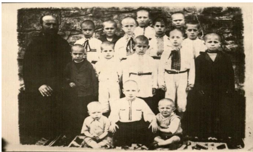
Унів, 1942 р.