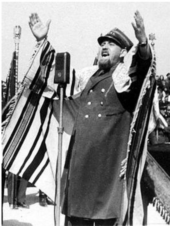
Давид Кахане, врятований братами Шептицькими; релігійний діяч, підполковник Війська Польського, головний равин Військово-повітряних сил Ізраїля