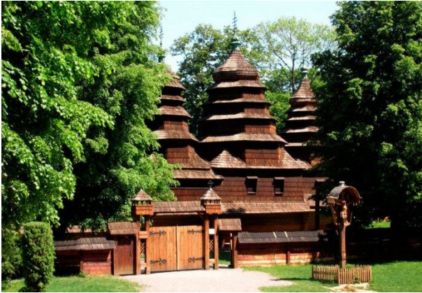
Церква святого Миколая у Шевченківському гаю у Львові

«Шевченківському гаю», адже якби ця церковця не стояла посеред лісу, скансен би не виник.