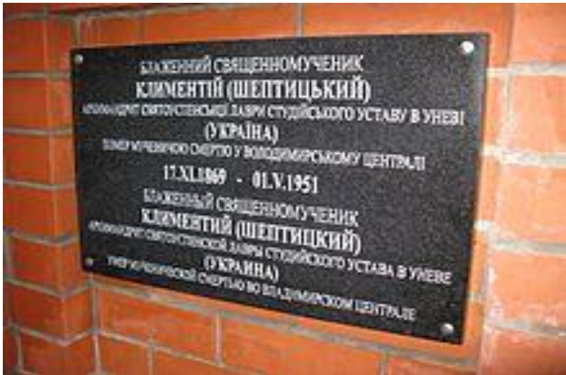
Меморіальна дошка Климентію Шептицькому на Князь-Владимирському цвинтарі у Владимирі, 2010 р.