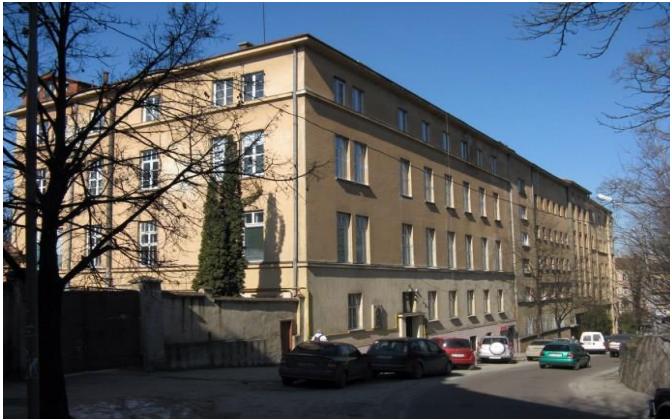
Народна лічниця імені Андрея Шептицького на вулиці Озаркевича у Львові

Одним з перших заходів на престолі була допомога у заснуванні у Львові «Народної лічниці» – української безкоштовної лікарні, яка повинна надавати допомогу всім без різниці у релігії чи національності. Для лікарні Шептицький виділив церковну ділянку на вулиці Петра Скарги (тепер вулиця Євгена Озаркевича – засновника «Лічниці»), вже згодом допоміг збудувати великий будинок для потреб медичного комплексу, який вважався тоді одним з найсучасніших у Львові.