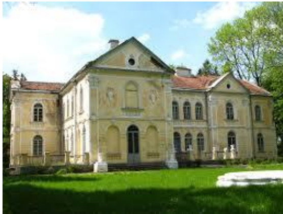
Палац Фредрів-Шептицьких у с. Прилбичах (Львівська область)

У подружжя Івана та Софії Шептицьких було сім синів. Два померли в дитячому віці, найстаршим сином Шептицьких був Роман, майбутній Митрополит. Загалом, родині Шептицьких випала трагічна доля. Від куль гестапо гине Олександр Шептицький, молодший брат Митрополита. У «золоту добу» 1939 року загін НКВД розстріляв у Прилбичах, у маєтку, наймолодшого брата Митрополита гра фа Лева з дружиною та їхнім духівником. Відтоді Митрополит уже ніколи не бував у своїх Прилбичах. Люди без принципів зруйнували і родинну усипальницю в то му ж селі. Довгі роки НКВД тримало там мінеральні добрива. Родинне гніздо Шептицьких – палац у селі Прилбичах – зруйнували більшовики, і сьогодні там залишилися тільки тополі, які ростуть іще з часів молодості Митрополита Андрія.